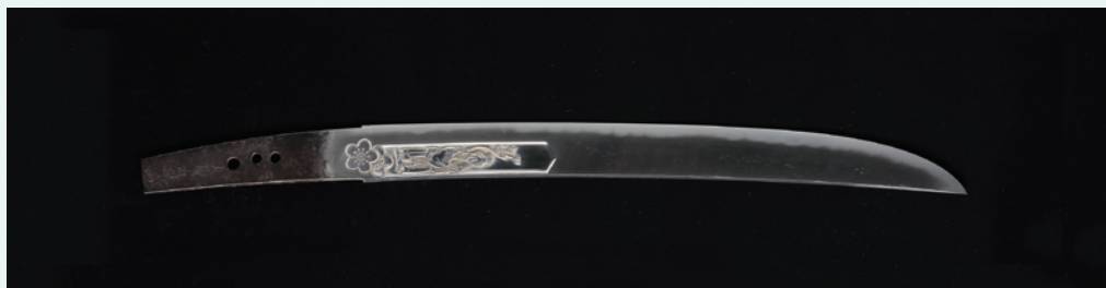
銘 大慶直胤 (花押) 彫よしたね 弘化七半仲春上旬 北野天満宮蔵