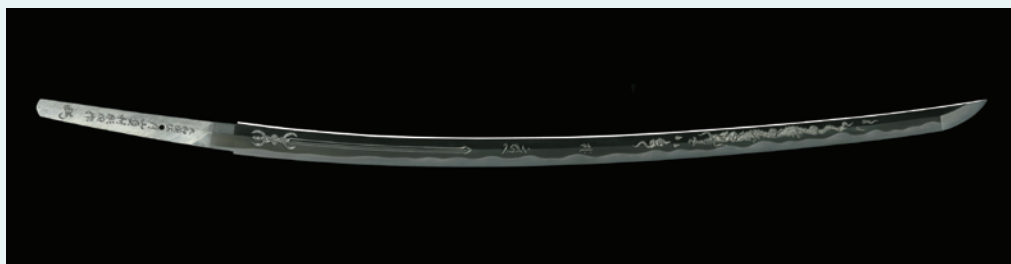
太刀 月山貞利彫同作 個人蔵

今回、日本刀文化振興協会のご協力により、現代の匠たちが自身の一押し作品を持ち寄り、皆様にご覧いただけるまたとない機会となりました。刀剣「今昔」の競演を、どうぞ心ゆくまでお楽しみください。