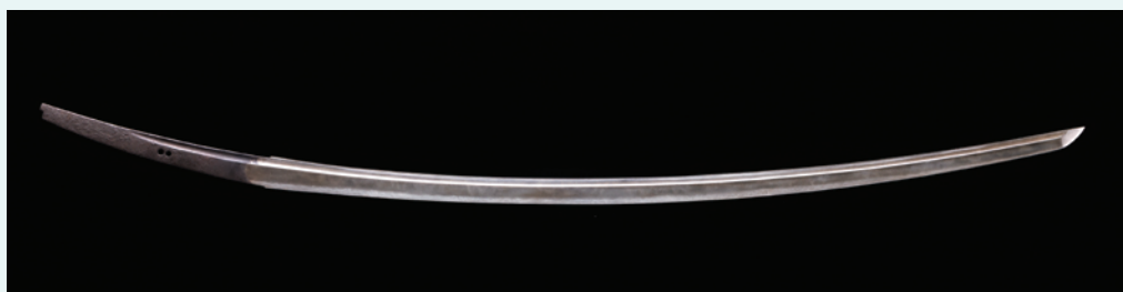
《鬼切丸 髭切》太刀拵え奉納プロジェクト 木製漆塗太刀 銘安綱 (鬼切丸 髭切) 彦十蒔絵道製作 令和8年