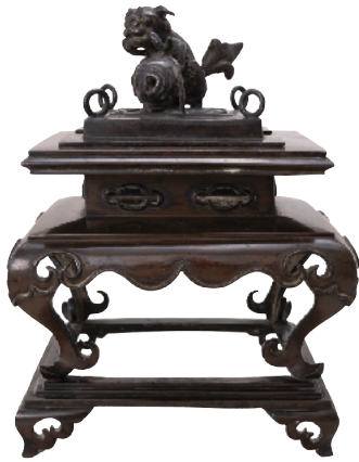
靈元天皇御奉納 香炉 江戸時代