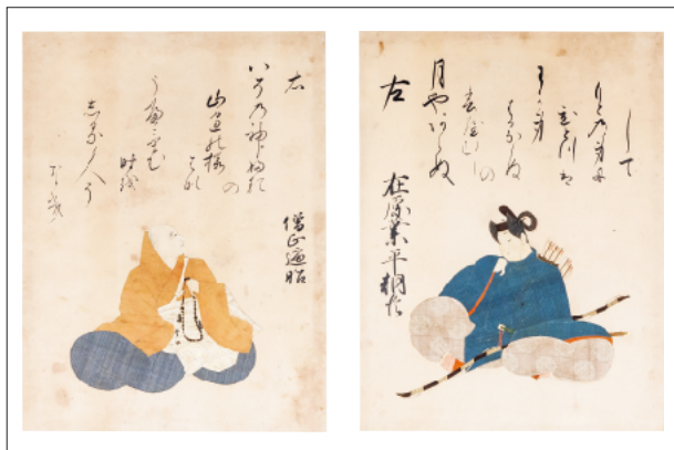
東福門院御奉納 三十六歌仙画帖 江戸時代