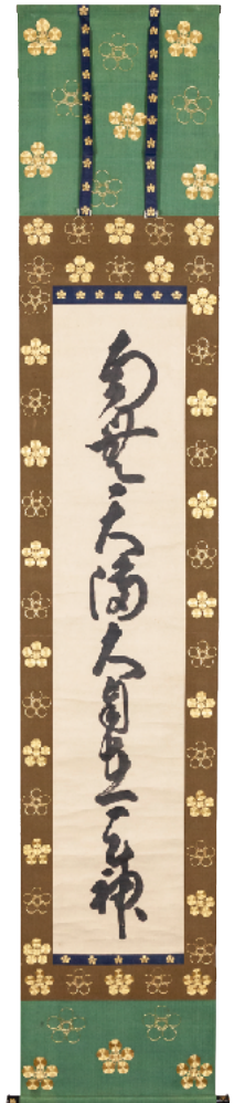
御神號 後水尾天皇 江戸時代