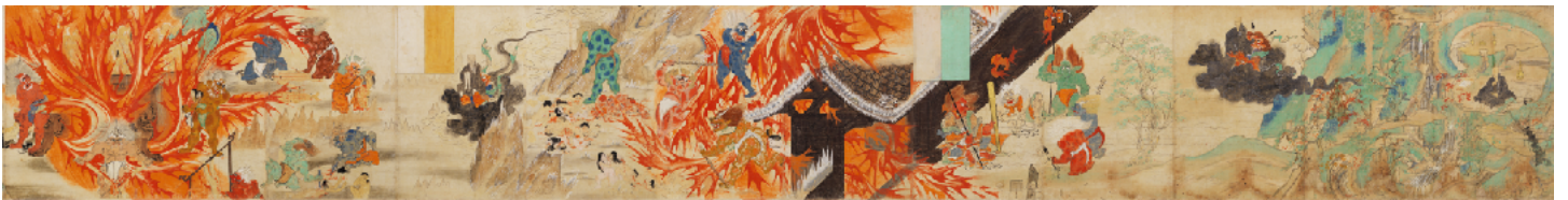
北野天神縁起絵巻 (平成記録本) 巻七 平成時代 (原本：鎌倉時代)

怒れる神―御霊から、およそ百年の歳月をかけて皇城鎮護の神となり、国難に際しては京を守護し、また学問や詩歌の神として人々に親しまれてきた天神様。それぞれの時代に当宮に寄せられた「天神信仰」の諸相を、書画・刀剣・各種工芸品など豊かな御神宝とともにご紹介いたします。