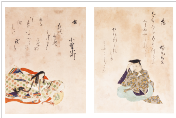
東福門院御奉納 三十六歌仙画帖 江戸時代